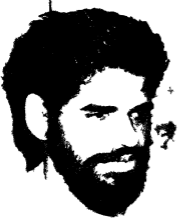
स्वामिन्श्री कर्मयोगा परम साधक पिनाथलालनगाठा